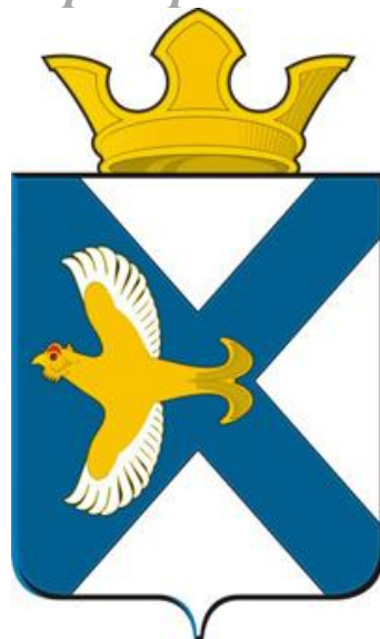
Схема теплоснабжения муниципального образования посёлок Боровский Тюменского муниципального района Тюменской области до 2040 года

Индивидуальный предприниматель Стахов А.А.