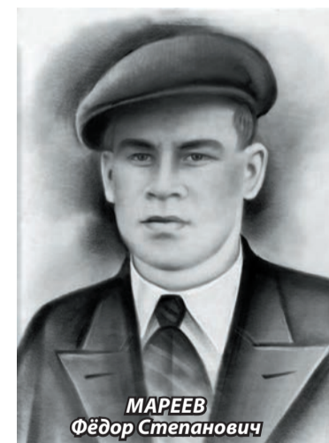
МАРЕЕВ Фёдор Степанович