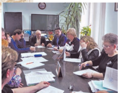
Администрация МО п. Боровский

Напомним, что недавно Боровская поселковая дума стала победителем конкурса представительных органов муниципальных образований Тюменского района.